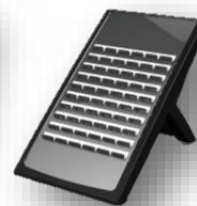
DSS คอนโซล 60 ปุ่ม