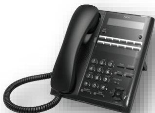
โทรศัพท์ดิจิทัลรุ่น 12 ปุ่ม