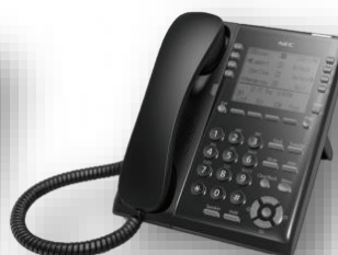
โทรศัพท์ IP รุ่น 8 ปุ่ม